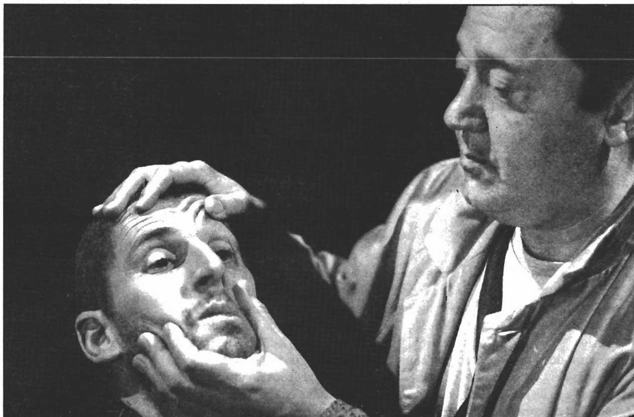
Matarile Teatro presenta en el Fórum su último espectáculo, "Teatro para camaleóns"