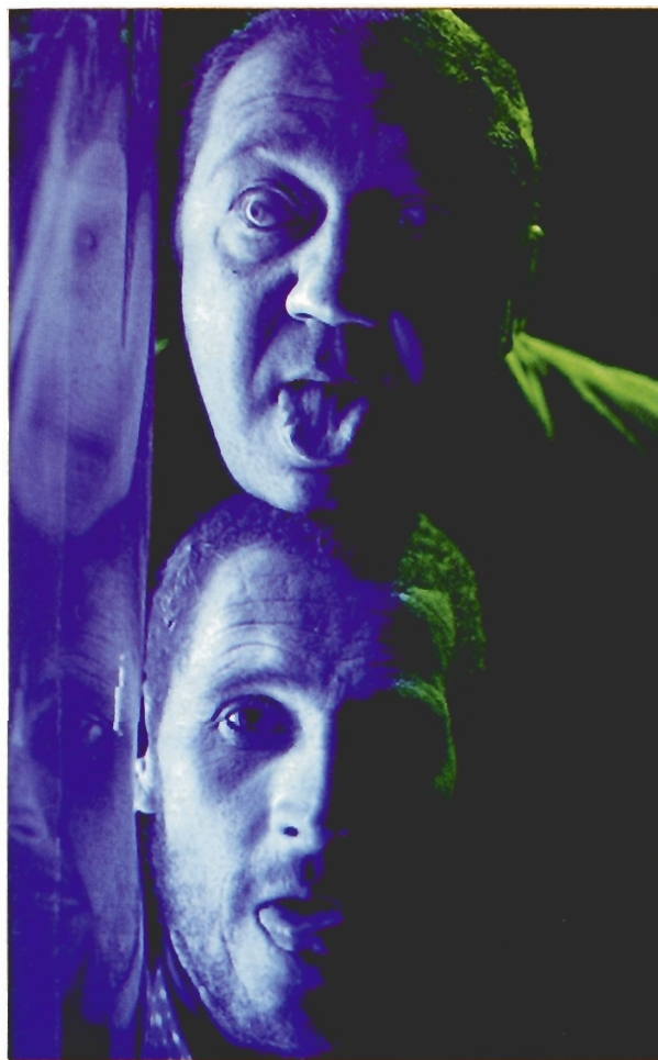
Teatro para Camaleones una obra de Matarile Teatro .

La compañía Matarile pretende mostrar la apariencia de las cosas, de los hechos y de las personas. Para ello utilizan la técnica de la observación y el estudio. Una observación que les ha hecho mirarse a ellos mismos para reírse y caricaturizarse. El objetivo: entender el desarreglo de vivir.