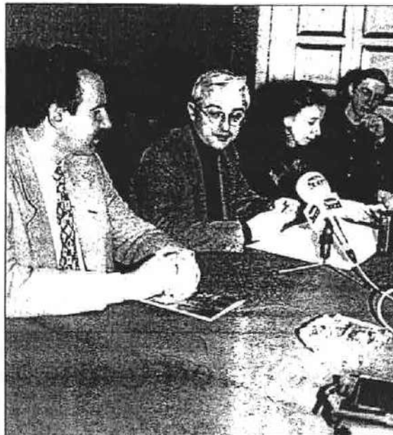
FIRMA DEL CONVENIO ENTRE EL AYUNTAMIENTO Y LA GALÁN F.V.