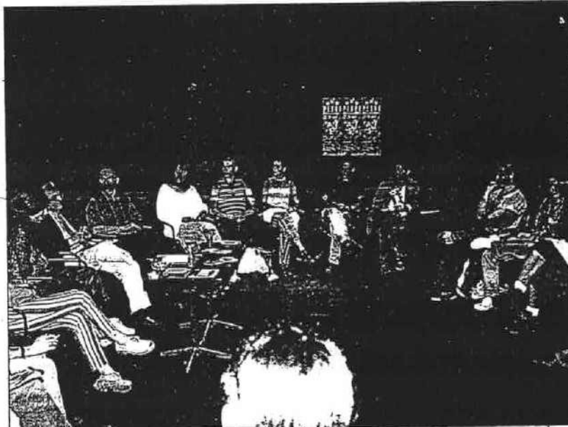
Os coreógrafos presentaron, xunto ós responsables do programa, as súas montaxes