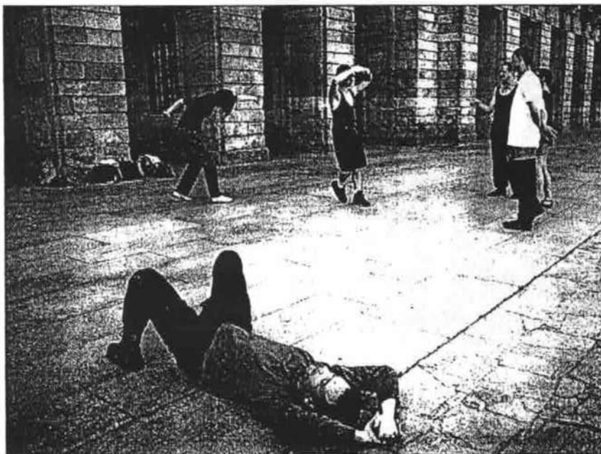
Provisional Danza ensaya «Los hombres también mueven paredes» en el espacio donde lo escenificará

De los cinco espectáculos coreográficos que se podrán ver entre hoy y mañana, hay dos que serán estreno en Santiago: El interior , de El Rayo Malayo; y Los hombres también mueven paredes , de Provisional Danza. Las otras tres propuestas son Capricho , de Inés Boza y Carles Mallol; Nada, la fuerza de existir , de Andrés Colchero; y Törtola , de Teresa Nieto.