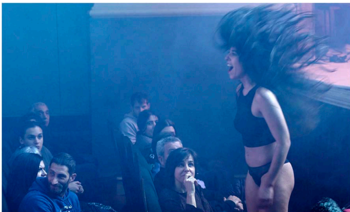
Parte da representación de 'Pussy cake' baixa ao patio de butacas

A min sorprendeume a reacción do público. Pensei que parte do mesmo podería marchar. Para min Pussy Cake é unha performance longa. Non é teatro nin danza. Está entre o teatral e o performativo. E paréceme formidable que non marchase ninguén, aínda que, se pasase, eu asumírao. Penso que os espectadores están dispostos a quedar alí, que queren saber o que vai pasar despois. A idea era que fose todo moi rápido, que houbera esa intensidade, sen transicións, a ritmo rápido, de xeito que cando rematase algo xa comezaba o seguinte.