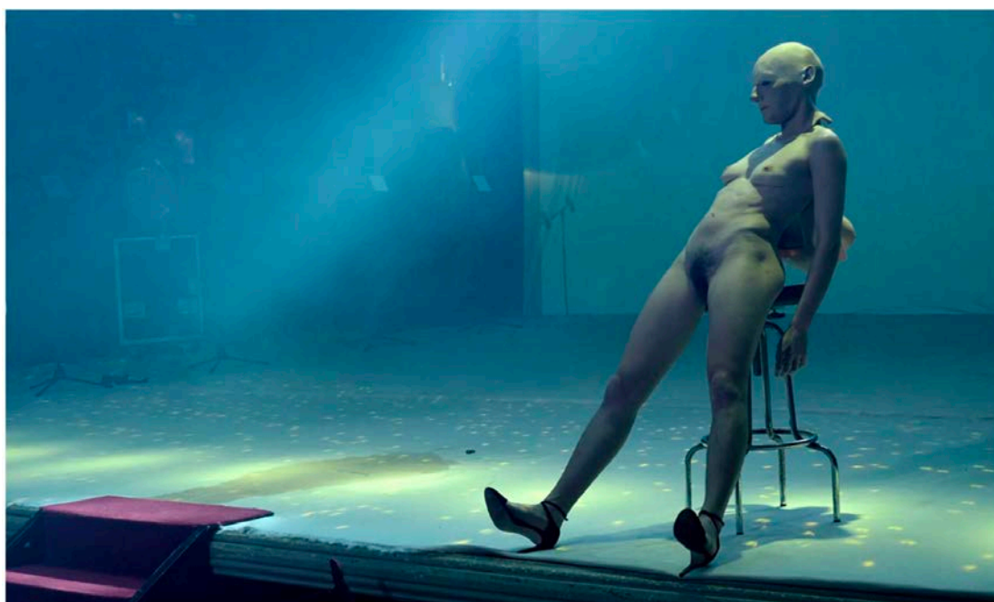
'Pussy cake', de Matarile, no Principal de Santiago

Ela tería agora a miña idade, 60 anos. E eu vexo as súas fotos, en branco e negro, moi potentes. Ás coreógrafas tamén lles dei a elixir entre varias músicas. Non quixen impoñer nada, senón estar aberto ao que elas quixesen achegar. Da mesma maneira, ningunha das intérpretes ensina nin un centímetro de pel que non queira ensinar. A a exposición de Dunia, nese aspecto, é a de máis risco. De feito, estou preparando unha contracrítica da crítica. Non estou disposto a aceptar valoracións morais. E que me digan que son un home dirixindo tres mulleres non é máis que unha obviedade. Ou que me digan que non cumpo as expectativas ou que produzo desasosego. Eu non traballo para cumprir expectativas nin para dar sosego. Nin para provocar, que sería moito máis fácil. Eu creo que fixemos algo serio, elegante, moi coidado, con delicadeza, aínda que sexa duro.