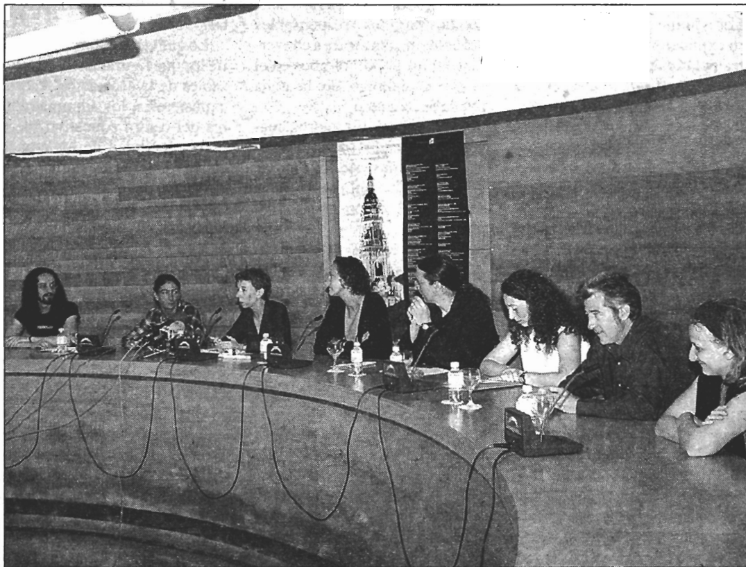
Algunos de los actores y responsables del montaje 'Primeiro Movimento: figuras brancas' del grupo Matarile