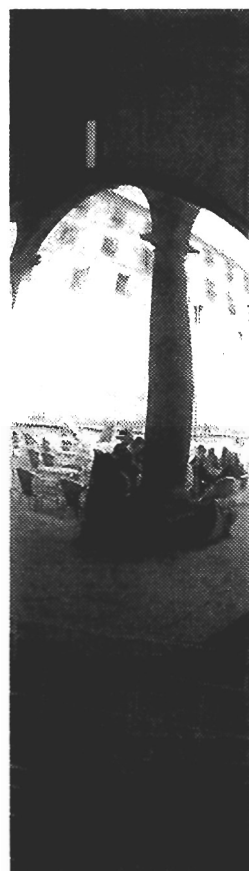
Matarile abre mañá o 'Compostela Millenium' na Quintana co espectáculo 'Primeiro movemento: para figuras brancas'

Primeiro movemento: para figuras brancas será