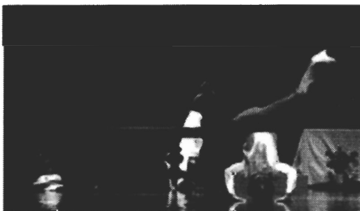
Cerrado por aburrimiento

(04/01/2010) A compañía Matarile Teatro volve á escena en Santiago coa súa última produción, Cerrado pro aburrimiento . Nela sitúase de novo no terreo da experimentación e a mestura de linguaxes escénicas, sen perder de vista o humor.