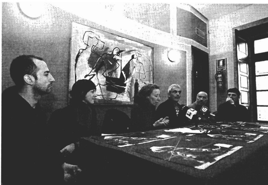
Parte del equipo de Matarile avanzó ayer algunas características de su último espectáculo

Después del estreno en noviembre en el Teatro Colón de A Coruña y de un ensayo abierto en el Auditorio de Galicia, Matarile espera una buena acogida de los espectadores en el Principal.