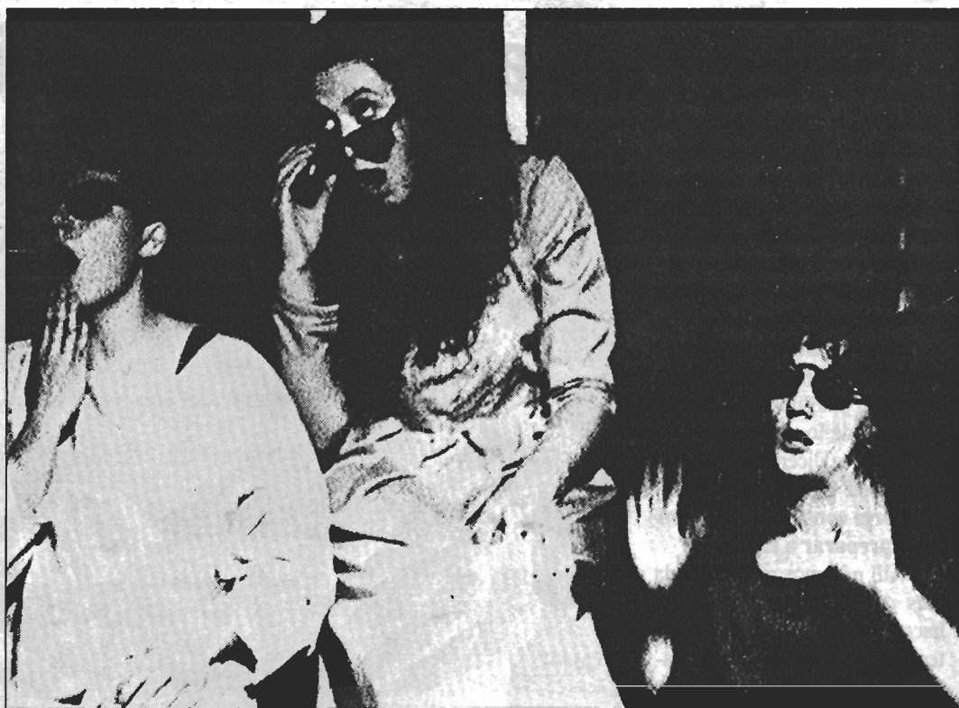
La compañía compostelana Matarile es la aportación gallega al panorama sobre teatro español actual