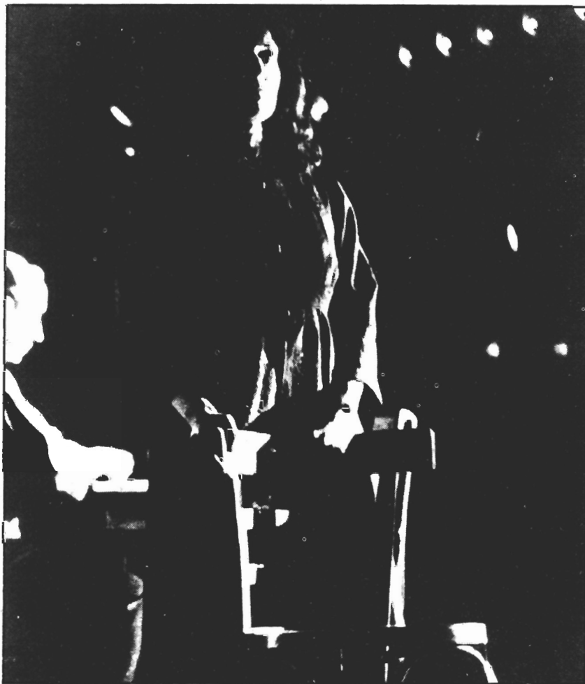
Un momento de la representación de "Café acústico".