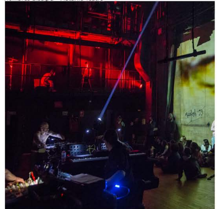
Hombres Bisagra - Matarile Teatro