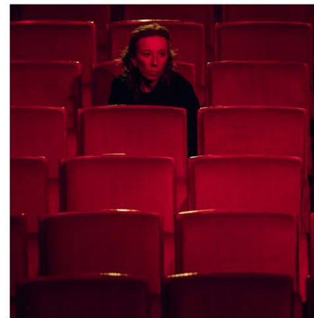
Staying Alive - Matarile Teatro