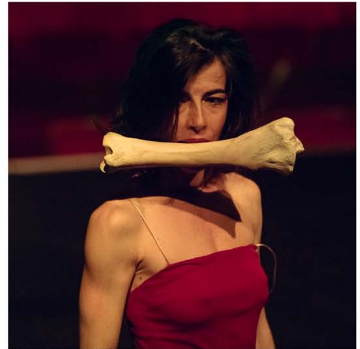
Staying Alive - Matarile Teatro

Premio Compostela de Teatro a la Labor Teatral Premio Xiria (Cangas) a la Labor Teatral Premio Zapatilla de ARTEZ 05 (Revista de Artes Escénicas, País Vasco), al equipo de programación y al festival Internacional de Danza En Pé de Pedra Premio de la Crítica de Galicia 2006 al festival Internacional de Danza En Pé de Pedra Premio Abrente 2010 del MIT de Ribadabia por la labor teatral de Matarile Teatro, el Teatro Galán y el festival Internacional En Pé de Pedra de danza contemporánea Nominación a los premios 2005 de la Feria Internacional de Teatro y Danza de Huesca a la Mejor Programación de Danza en España