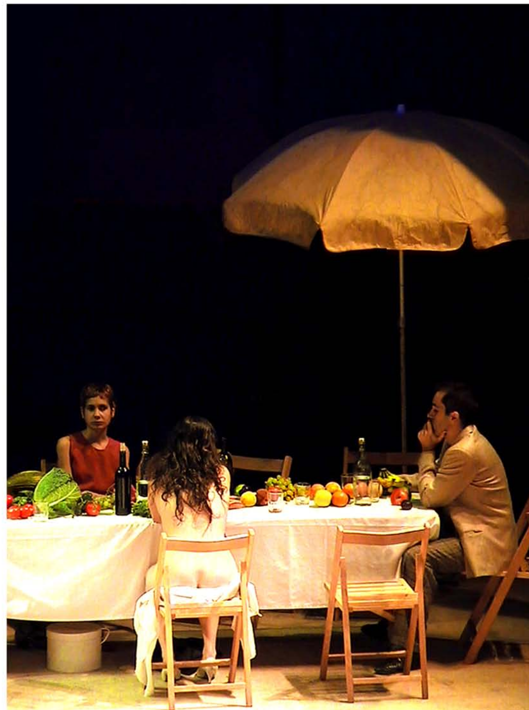
Historia Natural en el Teatro de la Abadía de Madrid

"Cerrado por Aburrimiento" "Staying Alive" "Teatro Invisible" y "El Cuello de la Jirafa"