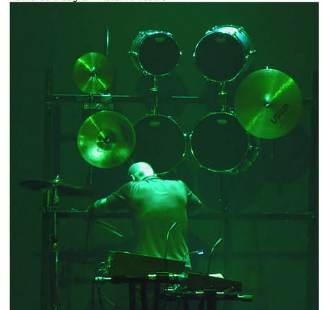
Hombres Bisagra - Matarile Teatro

Program of Naves Matadero–Contemporary Art Center, Oct. 2017