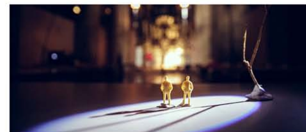
El Cuello de la Jirafa - Matarile Teatro