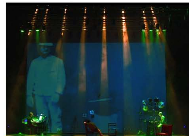
Hombres Bisagra - Matarile Teatro