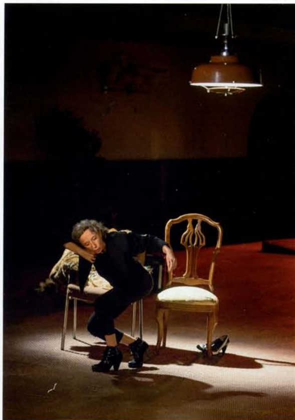
Staying alive

En lo que a la programación se refiere, “los trabajos seleccionados son de calidad dentro del pequeño y mediano formato de teatro contemporáneo, entendido teatro contemporáneo como flexible, es decir cubriendo variedad de estilos y géneros, dramáticos, espectáculos más poéticos, de danza.... otras formas y lenguajes que se están representando en territorios alternativos al comercial y al gran teatro institucional” aclara Pérez-Rasilla.