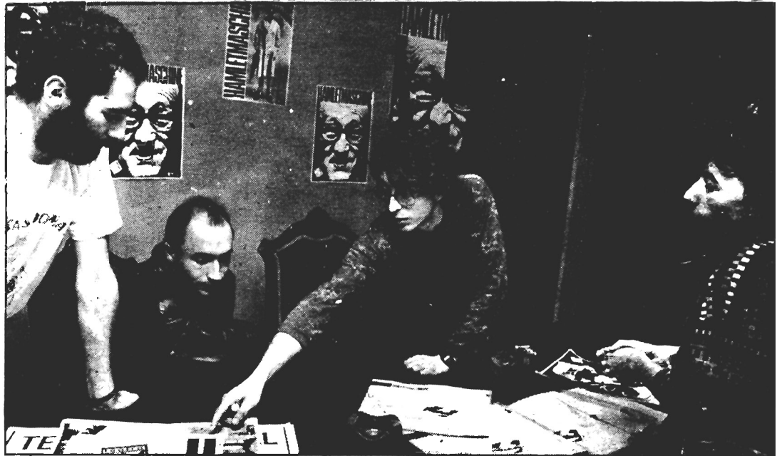
El grupo Matarile presentó ayer, en Santiago, su obra "Hamletmaschine"

"El espacio es adaptable. Pierde las dimensiones para llegar a cada sala", ésta es una de las características de la puesta en escena de este espectáculo que utiliza un espacio neutro, adaptado al recinto que tienen a su disposición. "la caja del teatro, en el que han de habitar Hamlet y Ofelia". Pese a todo, consideran que la