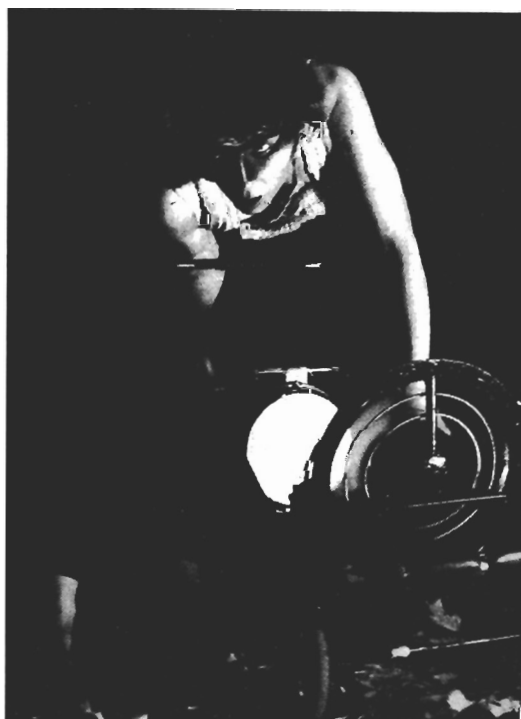
«Hamletmaschine» es un intento de destruir la obra de Shakespeare