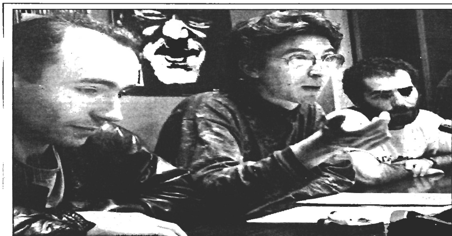
A obra, que se presenta hoxe e mañá no Principal, busca o conflito cos espectadores