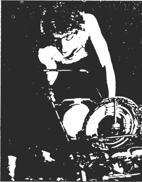
"Hamletmaschine", unha experiencia de avangarda a partir dun clásico